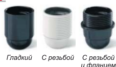
Гладкий С резьбой С резьбой и фланцем