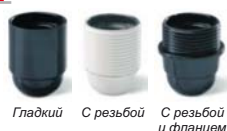
Гладкий С резьбой С резьбой и фланцем