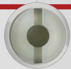
С 1P+N блокирующим выключателем