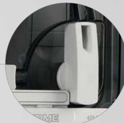
Дверца с замком в положениях 0 и 1