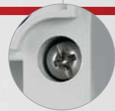
Винты из нержавеющей стали