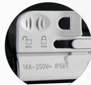
Замок на два положения 0 и 1