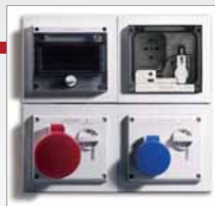
Совместимость с модульными системами