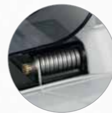
Автоматический пружинный механизм