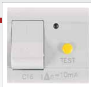
Возможна установка RCBO