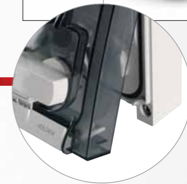
Крышка из дымчатого прозрачного поликарбоната