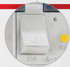
Версии без защиты, с предохранителем, MCB и RCBO